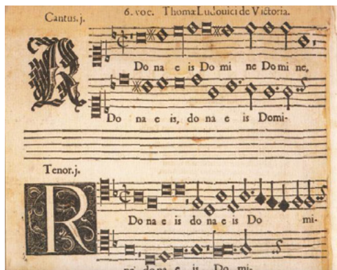
Begyndelsen af Tomás Luis de Victorias Requiem

“Noget af de helt specielle ved Tomás Luis de Victoria er, at der ikke er nogen anden – og aldrig har været det – der kan skabe så meget atmosfære ud fra så få toner. Hvis man ser på noderne til hans Requiem (Officium Defunctorum), tænker man, at det ikke er noget særligt. Hvis man spiller akkorderne på klaveret, tænker man “Var det bare det?”. Men når musikken synges, bliver det pludselig en helt anden oplevelse. Jeg ved ikke, hvordan han gør det – men Arvo Pärt kan faktisk noget lignende. Og især måden hans Requiem slutter på – det er den mest utrolige og smukke oplevelse.