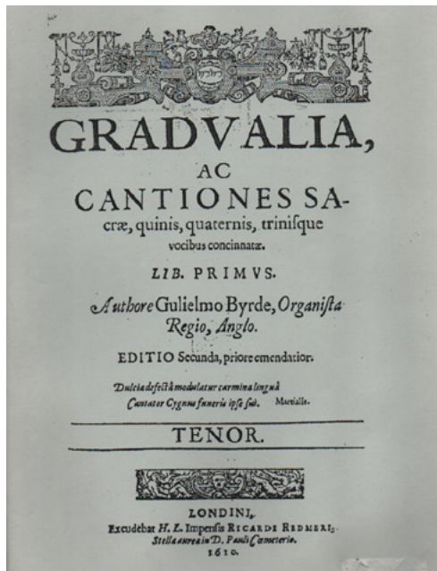
Titelbladet til William Byrds Gradualia, 1610-udgaven.